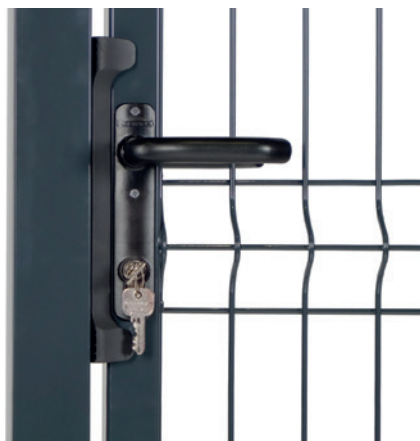
POIGNÉE ALUMINIUM 3006B-H, SERRURE FORTYLOCK + 3 CLÉS, PLAQUE DE PROPRETÉ 3020-HYB-STD

Disponible en 5 hauteurs (1m03, 1m23, 1m53, 1m73, 1m93) et 2 passages (1m00, 1m20). Existe en poussant ou tirant, gauche ou droite (À définir lors de votre commande).