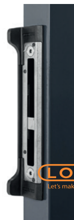
GACHE DE RÉCEPTION SFKI-QF40

LOCINOX ® Let's make better fences together